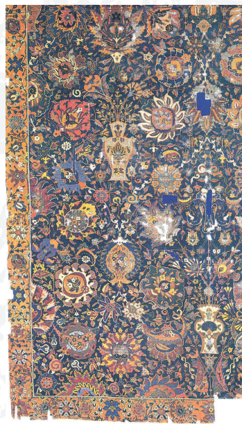
پاره فرشی با طرح مشهور به گلدانی، بافت کرمان، قرن ۱۱ هـ/۱۷ م ▲