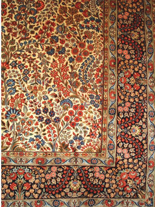
▲ قالی کرمان با نقشه مشهور به درختی سبزیکار

طرح‌های قالی کرمان را می‌توان به دو دوره مهم قالیبافی به ترتیب زیر تقسیم کرد: