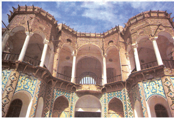
باغ و عمارت شاهزاده ماهان